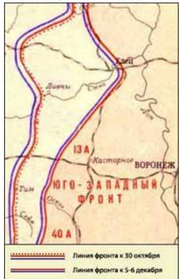
Фронт в октябре-декабре 1941 г.

Городской комитет обороны сосредоточил в своих руках партийную, военную и гражданскую власть. Основными направлениями работы комитета стало укрепление обороноспособности Воронежа, наращивание производства вооружения, боеприпасов, формирование воинских подразделений, эвакуацию в восточные районы страны промышленных предприятий и культурных ценностей. Была проведена большая работа по подготовке оборонительных сооружений вокруг города. Созданы укрепления вокруг стадиона "Динамо", в Березовой роще и в лесу возле СХИ. Силами тысяч воронежцев были вырыты противотанковые рвы вокруг города и на дальних подступах к нему. На шоссе и поперек улиц на въездах в город устраиваются противотанковые заграждения из врытых стоймя в землю кусков рельсов и металлических "ежей", изготавливаемых на воронежских заводах.