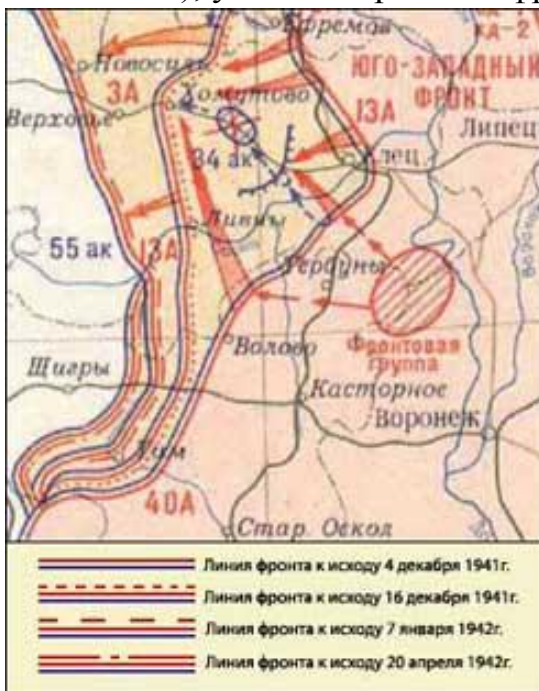
Боевые действия в период с декабря 1941 по апрель 1942

Тимошенко и Х.И. Баграмян. Так же как и с Красной Площадью в Москве, бойцы Юго-Западного фронта, промаршировав по площади 20-летия Октября (ныне пл. Ленина), уходили прямо на фронт.