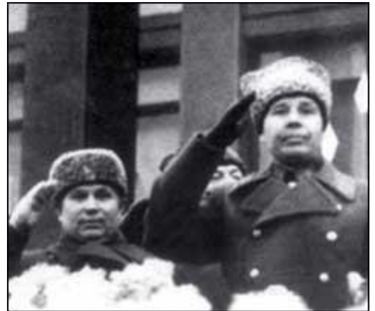
Маршал С.К. Тимошенко и член Военного Совета фронта Н.С. Хрущев на трибуне у Воронежского обкома КПСС во время парада 7 ноября 1941

7 ноября 1941 года советский народ встречал двадцать четвертую годовщину Октябрьской социалистической революции. По устоявшейся традиции, праздник отмечался военными парадами, но в этот труднейший для страны первый военный год, торжественные парады были проведены только в трех городах нашей страны: в Москве, Куйбышеве и Воронеже . В Воронеже в параде участвовали войска Юго-западного фронта. На городской площади парад принимали командующий фронтом маршал С.К.