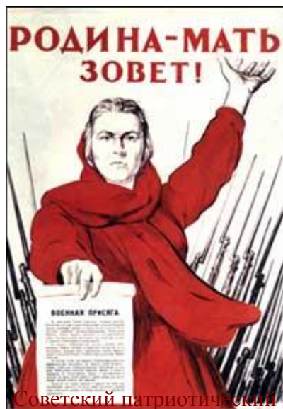
Советский патриотический плакат. И.М. Тоидзе. 1941 г.

На рассвете, в воскресенье 22 июня 1941 года, без объявления войны, вероломно нарушив договор о ненападении, немецко-фашистские войска вторглись на советскую землю. На всём протяжении советской границы, от Баренцева до Черного морей, завязалась ожесточённая и кровопролитная борьба. Началась Великая Отечественная война. Первые месяцы боёв были особенно тяжелыми для нашей страны. Красная Армия, неся большие потери, стремительно отступала на восток, оставляя город за городом.